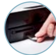
Skanning til USB