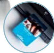
Spor til ID-kort i plastikk