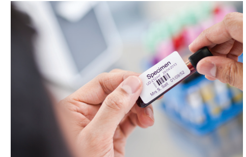
Bruk din egen spesialdesignet etikett.