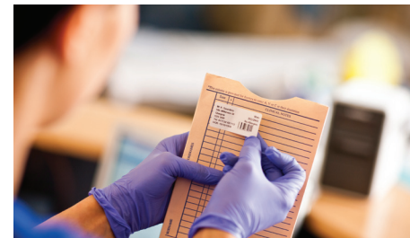
Med en etikett, finner du raskt pasientenes journaler og annen viktig dokumentasjon