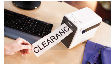
Rull i løpende lengde gir mulighet for større tekst

Øk produktiviteten og effektiviteten ved å legge til rette for at travle arbeidstakere i detaljhandelen kan skrive ut et bredt utvalg av etiketter ute i butikken, ved å bruke TD-2000 på en tralle/mobil arbeidsstasjon. Med sitt kompakte design er TD-2000 også ideell å bruke på en disk, uten å ta opp verdifull plass. Skarp tekst, logoer og strekkoder skrives ut raskt på Brother media av høy kvalitet, og kan bidra til økt kundetilfredshet i skranken eller ved utsjekking.