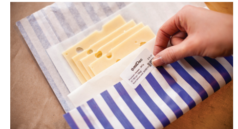
Ivareta sikkerheten for kundene med "Best før" etiketter