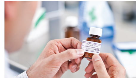
Etikettstørrelsene kan justeres til å passe tablettbeholdere i forskjellige størrelser