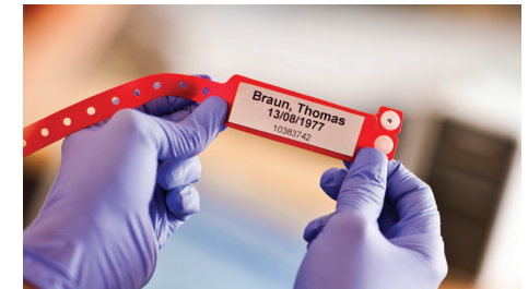
Skriv ut grunnleggende pasientopplysninger når det er nødvendig