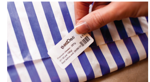
Limet brukt i Brother RD ruller er sertifisert som trygt for merking av matvarer