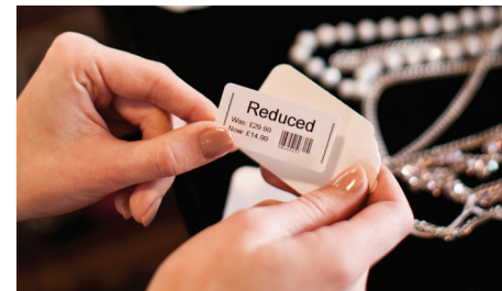
Få fart på salget ved å lage nye prisetiketter når du er ute i butikken