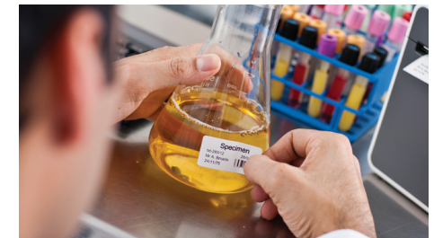
Sikre at pasientenes prøver er klart og korrekt merket