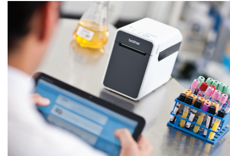
Økt frihet og mobilitet - skriv ut trådløst fra nesten hvilket som helst nettbrett eller håndholdt enhet.

The Mobile Software Development Kits (SDK) gjør det enkelt for utviklere å innlemme etikett- og kvitteringsutskrift til mobile apps. Det er SDK-er tilgjengelig for iOS™, Android™ og Windows Mobile™.