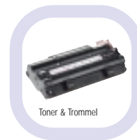
Toner &amp; Trommel